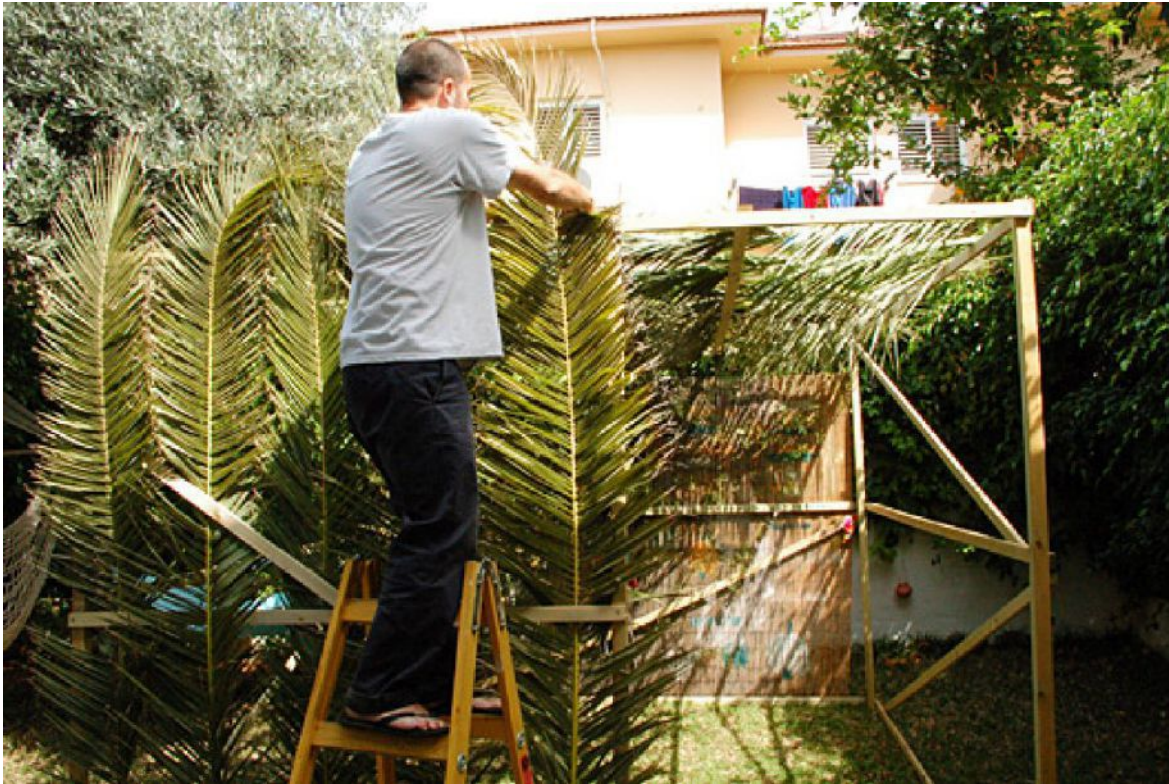
Familien-Sukka: Vater baut, Mutter und Tochter dekorieren

Da kann Jesus nicht anders und muss auf sich selbst als das göttliche Licht hinweisen. Gleichzeitig verspricht er den Menschen, die ihm nachfolgen, dass sie das Licht des Lebens haben werden. Licht, das war die erste Schöpfungstat Gottes. Licht und die Trennung von der Dunkelheit. Licht ist wichtig für